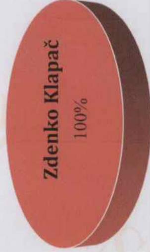
Vlasnička struktura prije i nakon mjera restrukturiranja

Tvrtka ZAPREŠIĆ PROJEKT d.o.o. je u 100%-tnom privatnom vlasništvu, a vlasnik je Zdenko Klapač. Nakon restrukturiranja vlasnička struktura tvrtke neće se mijenjati. U nastavku se nalazi grafički prikaz vlasničke strukture prije i nakon mjera restrukturiranja.